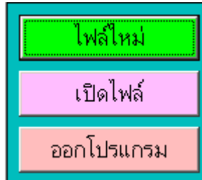
(ภาพประกอบ 1)

เมื่อเปิดโปรแกรม Evana 4.01 ขึ้นมาจะพบกับเมนู 3 เมนูดังภาพประกอบ 1